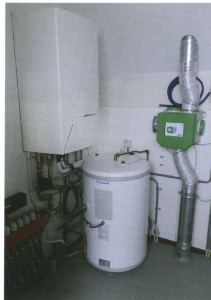
Wie zijn woning de afgelopen jaren heeft voorzien van duurzame installaties zoals pv-panelen of een warmtepomp, loopt de kans toch een indicatief G-label te ontvangen.