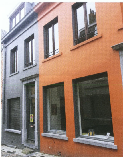
Het voorlopig label van een woning wordt ingeschat aan de hand van het bouwjaar of het laatste bekende energielabel.

voor een rechtsgeldige woningverkoop, niemand bij je huis komt kijken. De functie van energieadviseur is een controleur op afstand geworden. De energie-index, tot nu toe onderdeel van het label, verdwijnt. De energie-index is overigens wel nodig voor het woningwaarderingstelsel. Voor particulieren is het een vrijwillig instrument om 'een exactere bepaling van de energieprestatie van een woning te berekenen', schrijft de overheid. De beroepsvereniging FedEC reageerde een jaar geleden teleurgesteld in het minimale energielabel. Secretaris Richard Zwiers luidde destijds de noodklok. "Het voor-